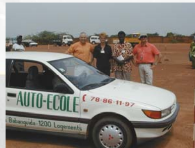
Visite technique de l'autodrome de Ouagadougou

Enfin, L'INSERR a proposé d'aller plus loin dans la démarche. Ainsi, une collaboration de l'INSERR pour créer un centre de formation adapté aux besoins spécifiques de leur pays, voire plus largement pour ceux de la zone de l'Afrique de l'Ouest est envisagée.