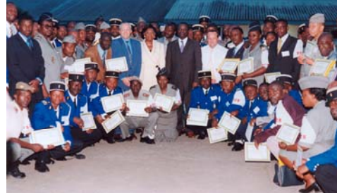
Formation de la BCR Gabon juillet 2004

Cette collaboration devrait être relancée dans les prochains mois avec l'accueil à Nevers de plusieurs fonctionnaires gabonais pour suivre un cursus complet de formation.